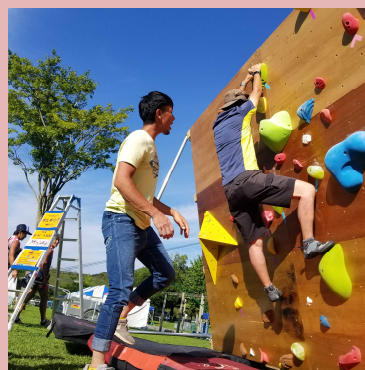
ボルダリング体験