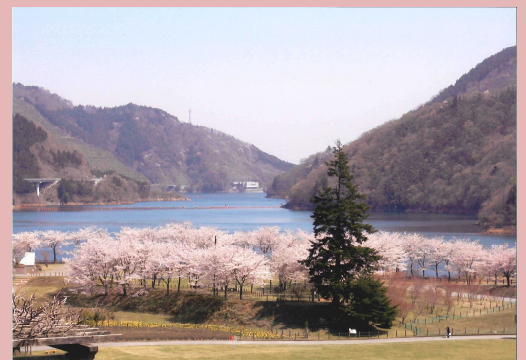
宮ヶ瀬湖畔園地（写真は昨年の様子）